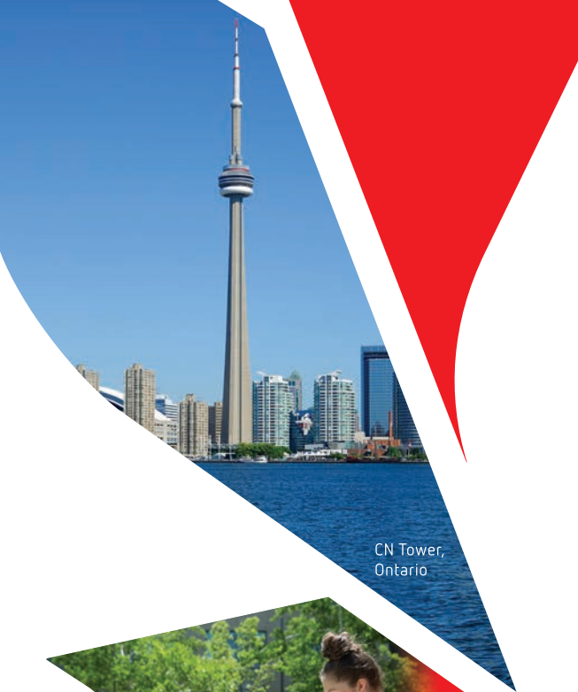
CN Tower, Ontario